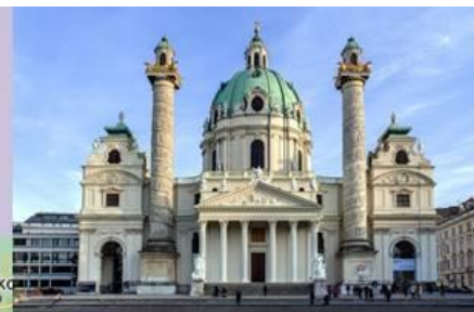
Kostol svätého Karola Boromejského (Viedeň)